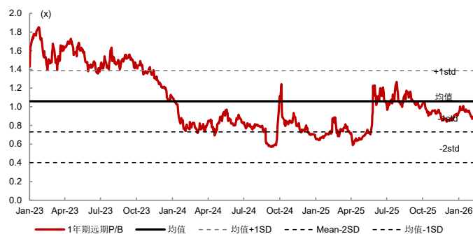
图表 6：众安在线—12 个月动态 P/B