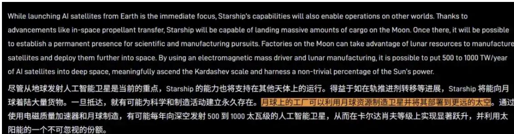
图表2: 马斯克提出在月球建立永久存在并作为进一步开展深空探索基地

SpaceX 转向优先实现无人登月。 财联社 2 月 7 日报道，据多位“知情人士”透露，SpaceX 已经告诉投资者将优先执行登月任务，并将在“稍晚些时候”尝试前往火星。公司正在以 2027 年 3 月为目标，尝试实施一次无人登月。在本周宣布 SpaceX 与人工智能公司 xAI 合并的备忘录中，兼任 SpaceX 首席执行官的马斯克概述了公司的长期计划，提及推动人类在月球上建立永久性存在，并将其作为进一步开展深空探索的基地。