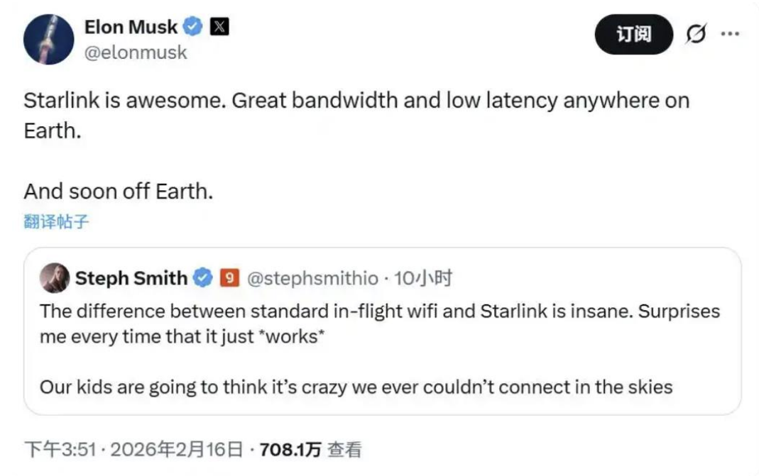
图表1: 马斯克宣称星链“很快”将在地球之外运行

星链或将在地球之外运行。 马斯克 2 月 16 日在社交媒体平台 X 表示：“星链太棒了，无论在地球何处，都能提供超高带宽和超低延迟，而且很快就能在地球之外服务了。”此前，马斯克曾暗示过星链有可能部署到地球之外，尤其是在 SpaceX 的月球和火星任务实现后。星链官方发布消息称，星链正在为全球 160 个国家、地区及多个市场，超过 1000 万名活跃用户提供高速互联网服务。