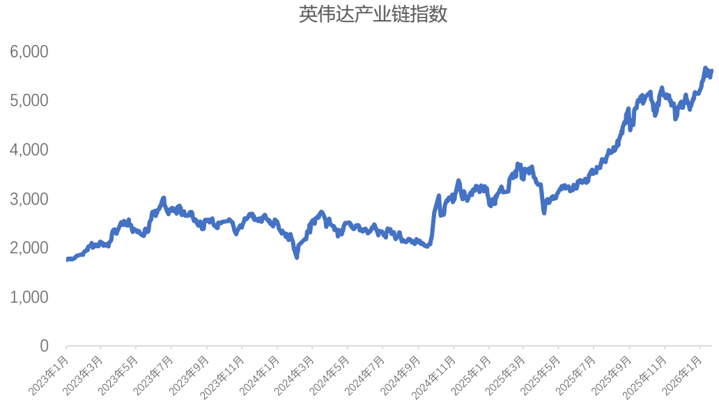
图表6：2023 年至今英伟达产业链指数走势

参考 NV 链历史行情，基建相关标的有望获得更高涨幅，尤其看好 SpaceX 链中太空光伏环节。2022 年 11 月 30 日 OpenAI 发布 ChatGPT，随后拉开本轮 AI 行情序幕，英伟达市值从 2022 年底的 3595 亿美元提升至 2025 年底的 45320 亿美元，涨幅高达 1161%，国内 A 股中英伟达产业链指数同样涨幅显著。就国内英伟达产业链成分股来看，2022 年底至 2025 年底涨幅靠前的标的为 新易盛（3480%）、中际旭创（3071%）、胜宏科技（2168%）、天孚通信（1514%），主要集中在光模块与 PCB 环节。我们认为，NV 链中光模块与 PCB 类似于产业基建环节，从而在产业趋势中获得更高涨幅，空天行业中 SpaceX 产业链与 NV 产业链类似，引领板块行情，太空光伏作为类似基建板块有望在长期收获更高涨幅。