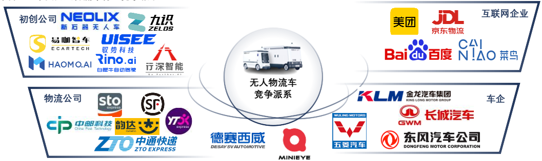
图表2: 中国无人物流车行业竞争派系