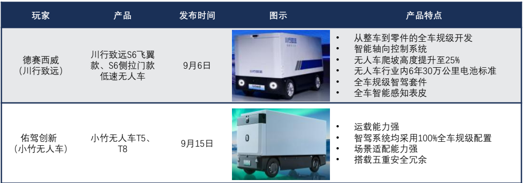
图表4：2025年无人物流车行业部分新入局玩家产品特点