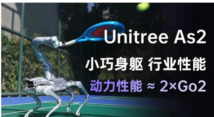
图 3：宇树科技发布第四款机器狗 Unitree As2

2 月 24 日，宇树科技发布第四款机器狗 Unitree As2。As2 动力性能约为 Go2 的两倍，峰值扭矩可达 90N.m，空载续航超 4 小时，极限速度 5m/s，IP54 防雨水，负载 15kg 续航超 13km。同时，As2 也开放了二次开发生态。根据宇树科技此前发布的官方声明，2024 年宇树科技的四足机器人约 80% 用于研究、教育和消费领域，20% 用于工业领域（如检测和消防），销售收入约占 65%，宇树科技的四足机器人销量占全球出货量的 60%-70%。