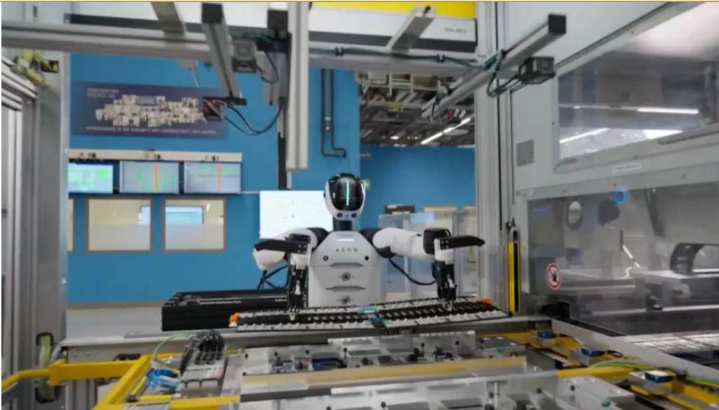
图 2：宝马欧洲工厂即将部署人形机器人 AEON

在技术方面，AEON 机器人集成了海克斯康在计量学领域的深厚积淀，配备了 22 个传感器和多类工业级摄像头，构成了一套微米级精度的移动测量系统。此外，这款轮式机器人还配备灵巧的机械手以及电池自动更换机制。在智能层面，AEON 由英伟达“三合一”计算平台深度赋能。其技能在英伟达 Omniverse 构建的数字孪生世界中，通过 Isaac Sim 进行仿真训练，将核心行走技能的掌握时间从数月缩短至数周。本体搭载的 Jetson Orin 车载电脑支持实时自主导航与任务决策。