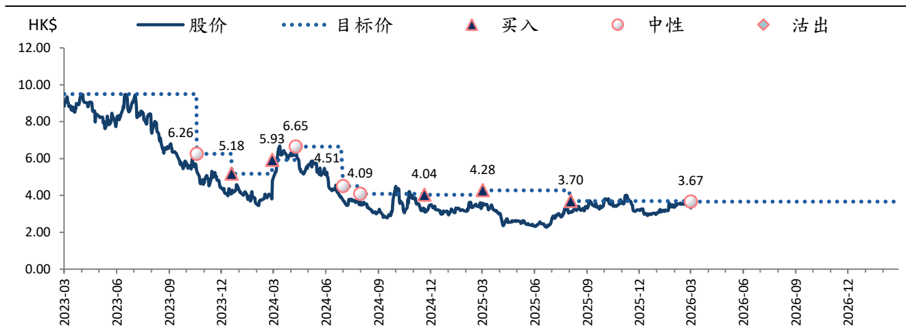
图表 3：信义光能 (968 HK) 目标价和评级