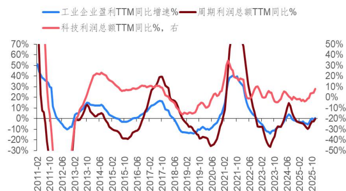
图 8：科技和周期盈利可能进一步上升