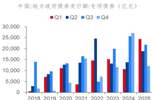
图 6：地方专项债呈增长趋势

短期来看，继续实施积极的财政政策和货币宽松可能对市场信心有支撑。(1) 维持赤字水平、新增促内需专项资金等继续提振经济和盈利预期：首先，CPI 增速和赤字率等目标和去年持平，同时安排中央预算内投资 7550 亿元、超长期特别国债 8000 亿元、新型政策性金融工具 8000 亿元等资金加大投资力度，继续维持 2500 亿元“以旧换新”规模和新增 1000 亿元促内需专项资金等可能提振消费。(2) 政策重点在着力扩内需和科技创新，同时继续强调反内卷，科技、周期和消费等行业的盈利都可能继续改善。(3) 继续实行适度宽松的货币政策可能使得流动性维持充裕：一是报告强调灵活高效运用降准降息等多种政策工具，宏观流动性可能维持充裕。二是继续强调健全中长期资金入市机制，机构资金可能继续加大流入股市。三是对财政和货币政策积极的定调以及“十五五”规划对行业发展的明确可能对当前偏低的市場情绪有提振。