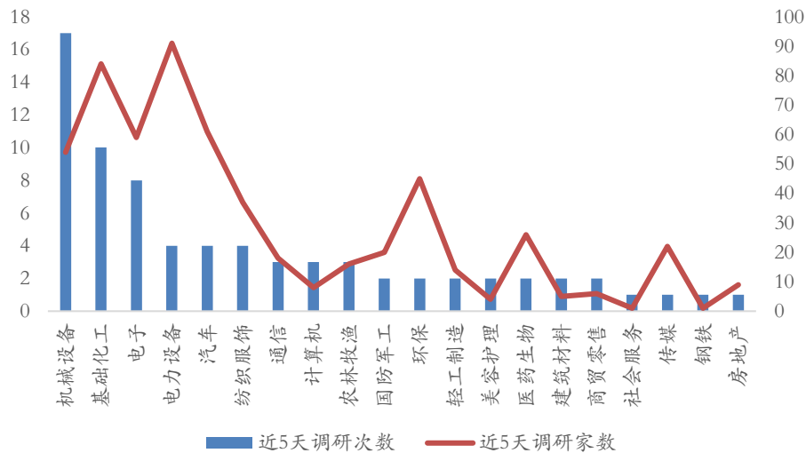
图 1：近 5 天行业调研热度

本周 (2026/3/2-2026/3/6)，一级行业中，按机构被调研总次数从高到低排序，机械设备、基础化工、电子的关注度较高，其中电力设备、基础化工的近 5 天调研机构家数较多。对比上周调研情况，本周基础化工成为机构关注新焦点，机构关注方向朝周期转移。