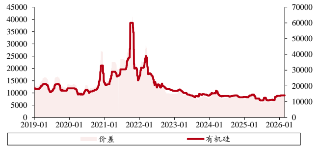
图表 7. 有机硅价格、价差（单位：元/吨）