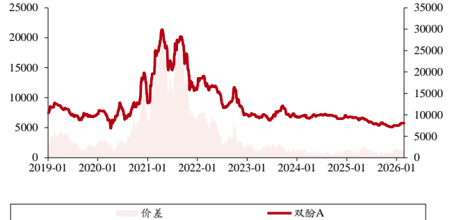
图表 5. 双酚 A 价格、价差（单位：元/吨）