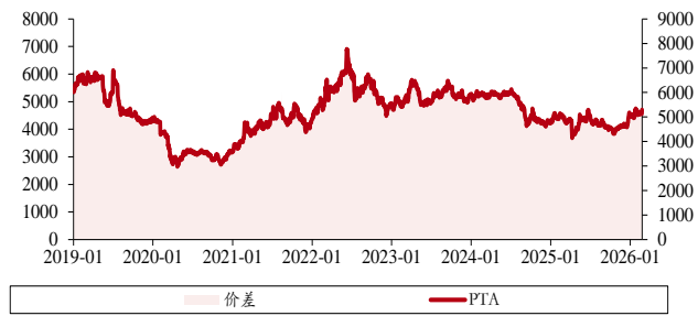
图表 6. PTA 价格、价差（单位：元/吨）