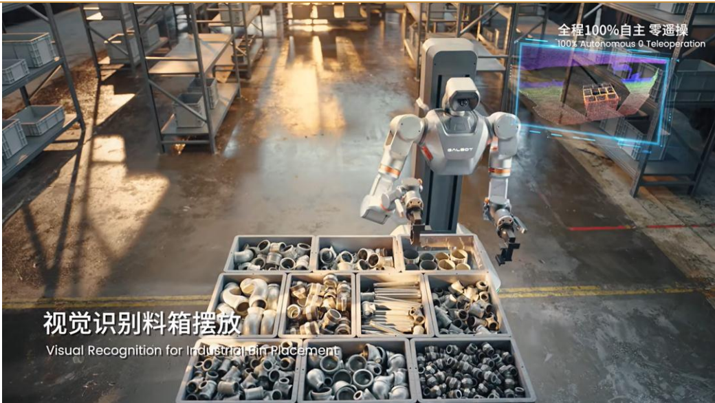
图 3: Galbot S1 工业级重载机器人