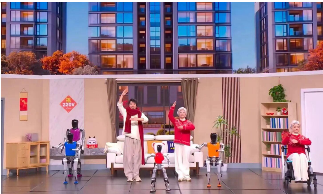
图 2：松延动力上春晚

3月2日，松延动力宣布完成B轮融资近10亿。本轮融资由宁德时代系产业投资平台晨道资本领投，国科投资、京国盛基金、九合创投等知名机构跟投，B轮融资规模累计近10亿元。松延动力已累计完成了9轮融资。