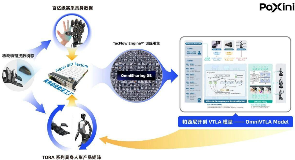
图 4: 百亿级实采全模态数据

帕西尼再获超 10 亿融资, 估值破 100 亿。本轮由知名双币基金黄浦江资本、凯泰资本、顶级国资信安资本重磅领投, 某规模数百亿元的知名双币基金、珠海科技产业集团、善达资本、海川基金等联合投资, 北京某知名国资平台、广州市新兴基金、上市公司优利德、知来资本、LEO LION、南岭基金、相城金控等跟投, 毅达资本等数家老股东持续超额加码。