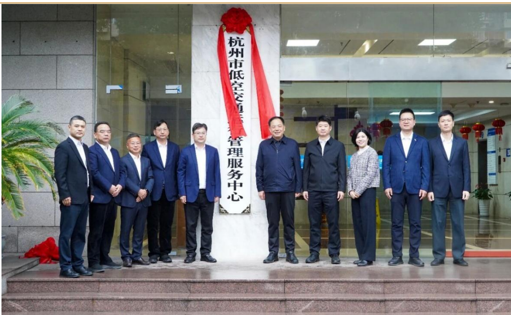
图 2：杭州市低空交通运行管理服务中心正式挂牌

2月24日，杭州市低空交通运行管理服务中心正式挂牌。为全面构建我市低空交通管理体系，经市委编办批准，市交通运输局优化调整下属单位机构设置，依托杭州市公路与港航管理服务中心加挂杭州市低空交通运行管理服务中心牌子，具体承担全市低空交通运行管理服务相关职能。