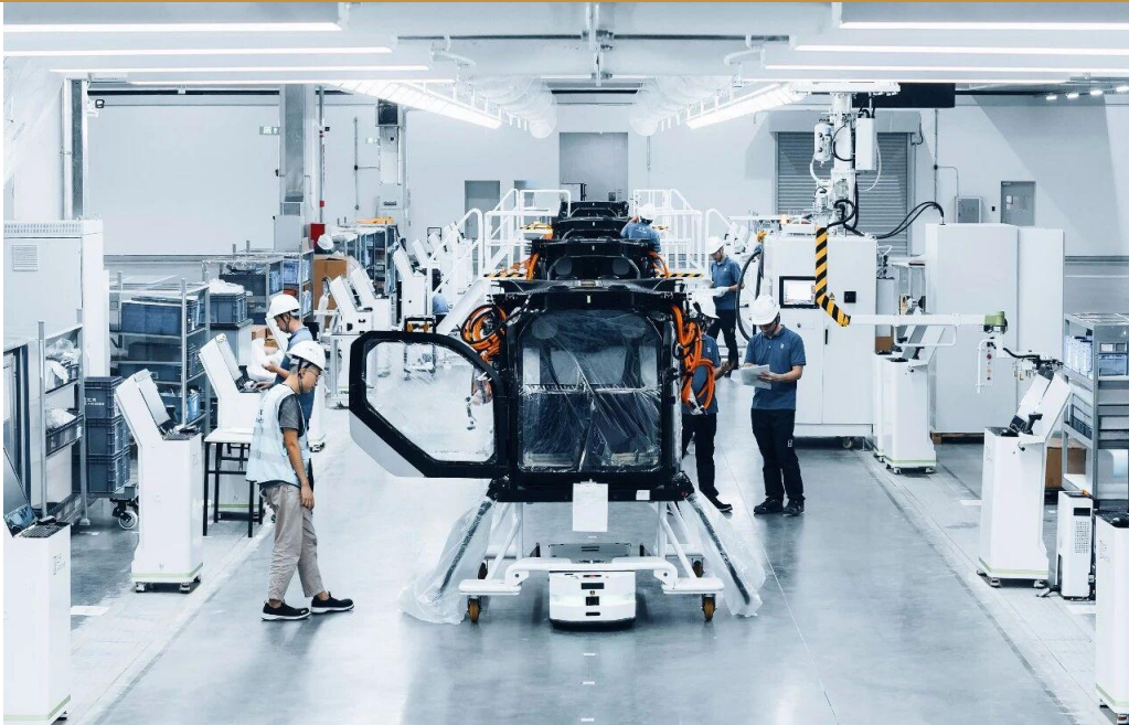
图 3: 汇天飞行汽车量产工厂