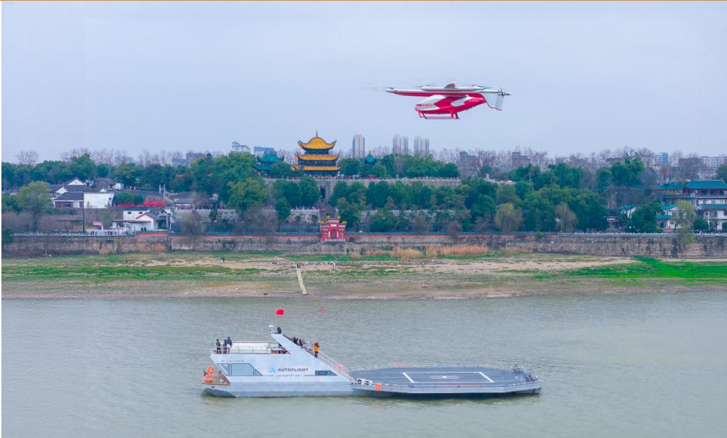
图 5: 峰飞航空与岳阳达成战略合作

峰飞航空与岳阳达成战略合作。 2月25日,峰飞航空科技2吨级eVTOL航空器与SUNSHIP零碳水上机场组成的“海空一体”解决方案在岳阳楼下完成首次低空文旅验证飞行演示。峰飞航空与岳阳市达成战略合作,将依托峰飞航空eVTOL技术及低空全链条解决方案,结合岳阳“大江大湖”典型地理场景和“岳阳楼-君山岛-洞庭湖”世界级文旅资源,携手打造覆盖水陆空物流、低空文旅、应急救援、空中交通的运营体系,为岳阳这座江湖名城注入低空经济新动能。