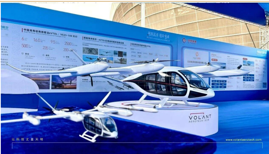
图 4: 南航通航携手沃兰特亮相南海西部油田工业化应用启航大会

沃兰特获首份客运 eVTOL 确认订单。 2月28日, 中国海油集团在湛江举办南海西部油田工业化应用启航大会, 并发布了国内首个海上油田低空经济应用体系的发展成果。中国海油在 41 座海上平台和 2 个陆地终端厂已构建起了覆盖海底管线巡线、物流配送、应急安防等多场景的无人机作业体系, 并与南航集团联合创新构建“空海一体”智能作业平台与标准化管理流程, 在国内率先实现了海上油田的多场景融合、体系化运行、规模化部署与常态化应用。南航通航携手沃兰特亮相南海西部油田工业化应用启航大会。沃兰特作为南航通航在低空经济领域的核心合作伙伴, 签署了行业首份客运 eVTOL 的确认订单。