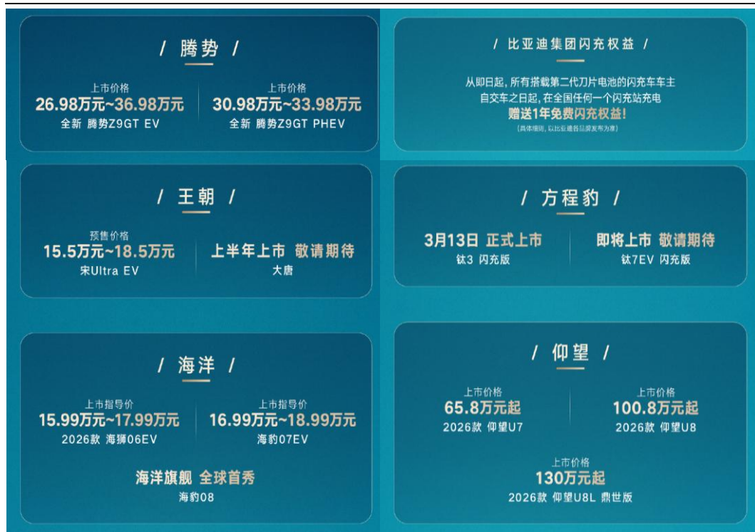
图表 2: 首批搭载车型覆盖王朝、海洋、方程豹、腾势、仰望品牌的 12 款车型