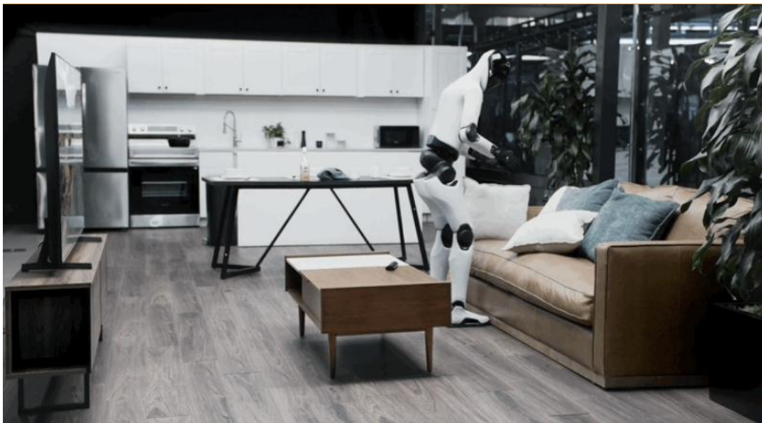
图 3：Figure 发布新视频，机器人 Figure 03 能够完全自主地整理客厅

随着可执行任务的不断增加，Helix 02 的技能库持续扩充，将逐步迈向一套人形机器人系统，就能完成家庭与办公场景下的各类日常任务。