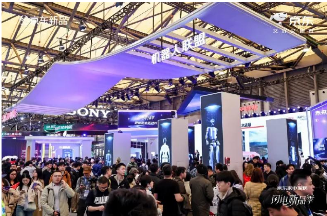
图 2: 机器人厂商集中亮相 AWE2026

机器人厂商集中亮相 AWE2026。 3月12日,2026年中国家电及消费电子博览会(AWE2026)在上海拉开帷幕,宇树、智元等众多机器人厂商集中亮相,特斯拉人形机器人 Tesla Bot 也在现场展出。此外,多款新品也在展会现场迎来京东独家首发。其中,宇树科技带来了京东独家定制版 R1 JoyInside 蓝白色人形机器人,其搭载京东 JoyAI 语音大模型,可实现流畅自然的语音互动,轻量化机身搭载强大的运动能力,使其能够胜任家庭陪伴、娱乐展示、教育学习等多种场景。Zeroth 元点智能小迷你 M1 陪伴机器人聚焦银发关怀,具备老人跌倒监测报警、AI 中医问诊、定制回忆录等贴心功能。镜识科技 BaoBao 机器人拥有人形、狗形双形态自由切换的创新形态,同时内置 JoyInside 支持的智能跟随、AI 陪学等功能。此外,以情感陪伴、实时回应、数据存忆为核心卖点的 Toycity 小耙 AI 随身版,以及形态独特、具备感应行走功能的云深处机器马也迎来独家首发和预售。