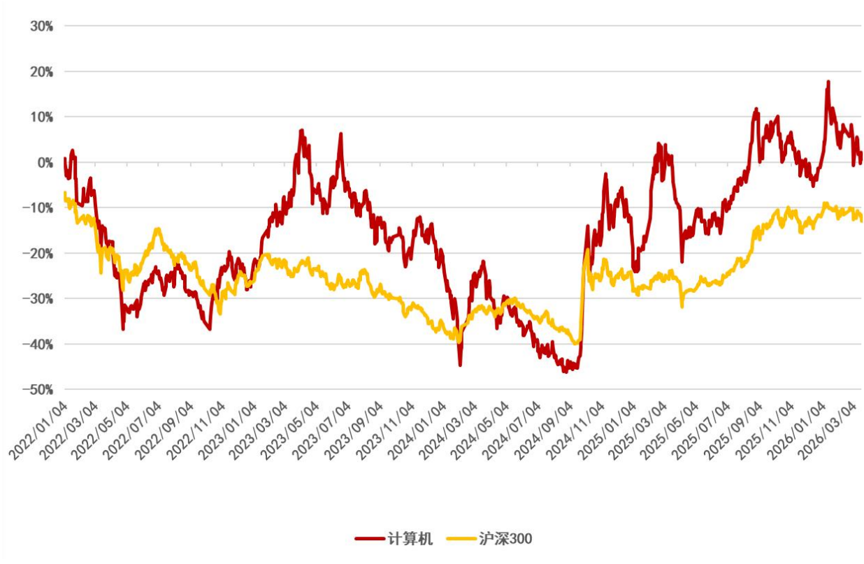
图 1：申万计算机行业 2022 年初至今行情走势（单位：%）（截至 2026 年 3 月 19 日）

申万计算机板块近 2 周（2026/3/6-2026/3/19）累计下跌 0.20%，跑赢沪深 300 指数 1.19 个百分点，在 31 个申万一级行业中排名第 9 名；申万计算机板块 3 月累计下跌 7.05%，跑输沪深 300 指数 4.34 个百分点；申万计算机板块今年累计上涨 0.95%，跑赢沪深 300 指数 1.96 个百分点。