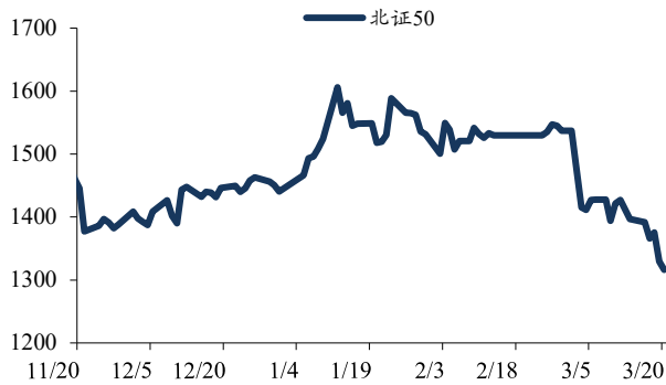
图1: 北证 50 指数月度表现