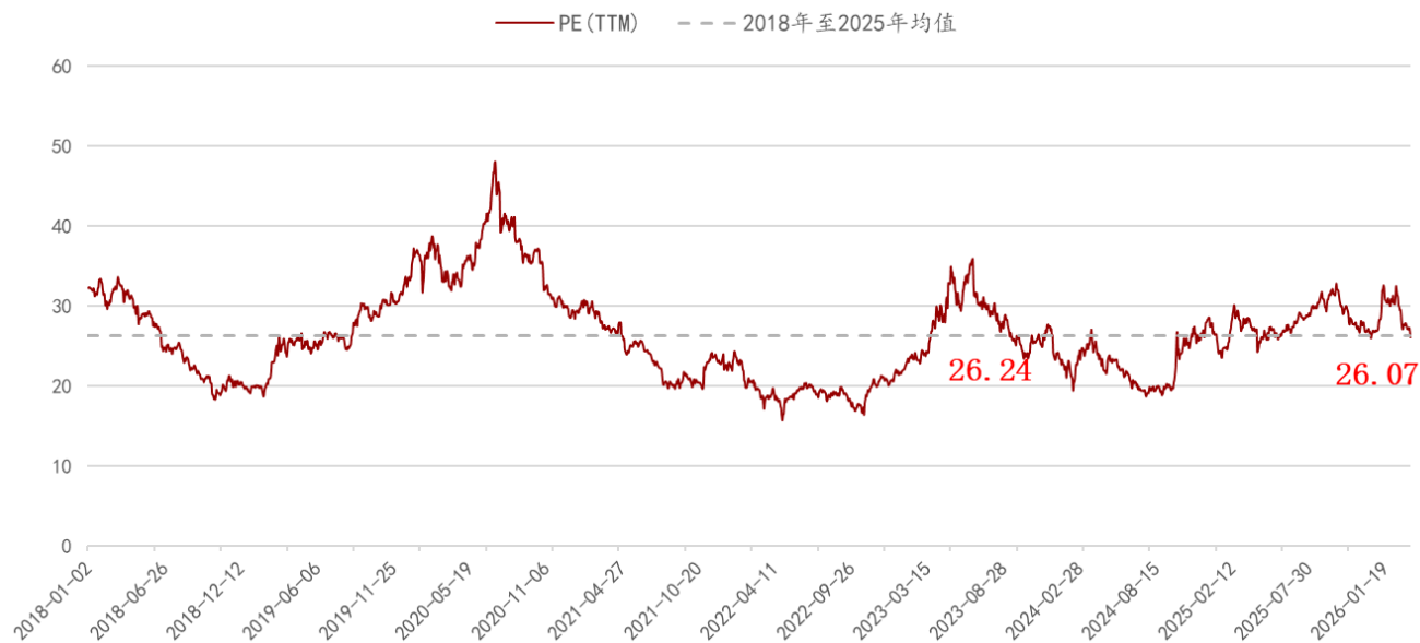
图表3: 申万传媒行业估值情况 (2018年至今)

估值略低于 2018-2025 年均值水平。从估值情况来看, SW 传媒行业 PE (TTM) 估值上周有所下跌, 从 27.10X 震荡跌至 26.07X, 略低于 2018-2025 年均值水平 26.24X, 下跌幅度为 0.64%。