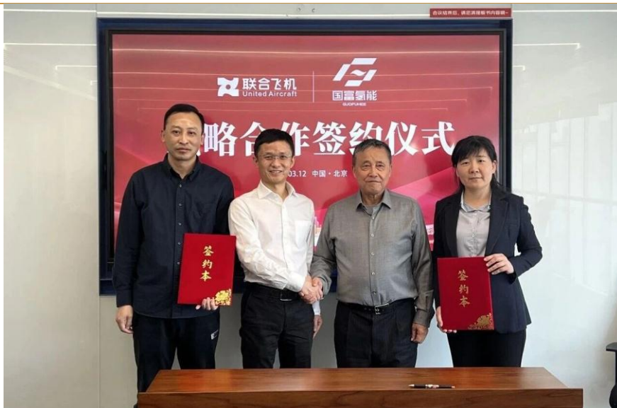
图 4：国富氢能与联合飞机达成战略合作

国富氢能携手联合飞机，深化氢能低空经济全场景合作。3月12日，江苏国富氢能技术装备股份有限公司与联合飞机集团在京签署战略合作协议。双方将以氢能技术为核心纽带，围绕新能源低空经济展开全方位合作，共同开拓氢能在高端航空装备、航天发射等领域的创新应用。