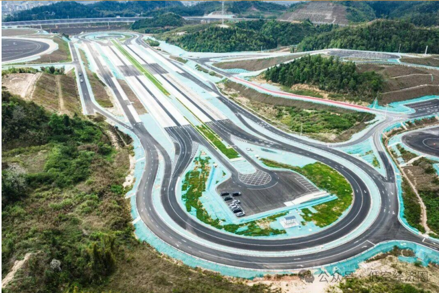
图 3：路空一体智能网联大型综合性测试基地

3月20日，国家智能网联汽车质检中心、广东省低空经济中试平台（筹）能力发布会暨南方试验场启用仪式在韶关市新丰县举行，标志着国内首个路空一体智能网联大型综合性测试基地正式投运。作为国内首个获批空域使用权的大型综合试验场，南方（韶关）智能网联新能源汽车试验检测中心（以下简称南方试验场）占地8600亩、总投资近36亿元，获批空域100平方公里。