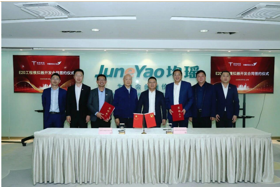
图 2: 时的科技与华模科技正式签署合作协议

时的科技与 RortiX 达成深度战略合作，签署 100 架 E20 eVTOL 采购协议。 RortiX 是一家以“AI+”与“具身智能”为内核的科技公司，致力于打造开放的“AI+低空”平台。此次合作，RortiX 不仅达成 100 架 E20 eVTOL 用于低空经济的场景运营战略合作，同时充分发挥自身在 AI 技术、全球拓展等领域的优势，共同探索 eVTOL 在更多场景的创新应用。