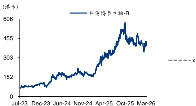
图表3: 科伦博泰生物-BPE-Bands