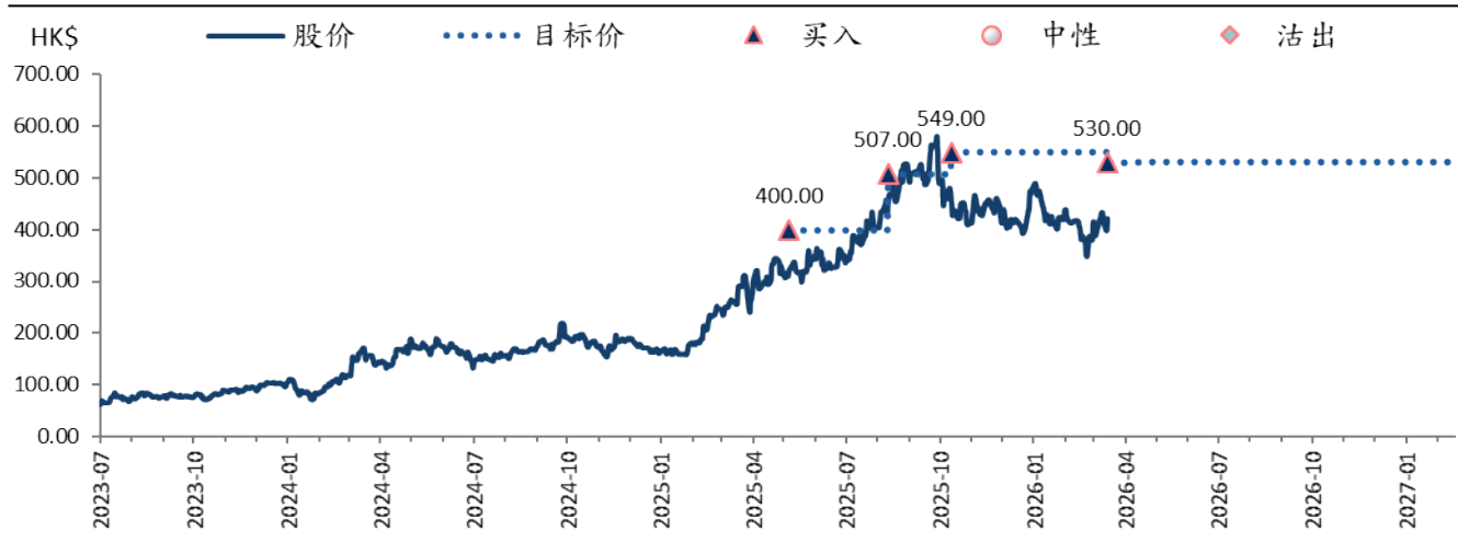
图表 2：科伦博泰生物 (6990 HK) 目标价及评级