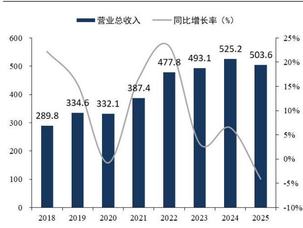
图1：海油发展营业收入及增速

2025 年归母净利润同比增长 6.2%，业绩略低于预期，主要由于油价中枢下降，能源物流服务板块营收、利润下滑所致。公司 2025 年营业收入 503.6 亿元（同比-4.1%），归母净利润 38.8 亿元（同比+6.2%），扣非归母净利润 39.2 亿元（同比+2.9%）；单四季度营业收入 164.2 亿元（同比-12.9%），归母净利润 10.3 亿元（同比+6.6%），扣非归母净利润 10.6 亿元（同比-19.3%）。公司 2025 年毛利率达到 16.1%（同比+1.5pcts），净利率 7.9%（同比+0.8pcts），扣非净利率 7.8%（同比+0.5pcts），均为上市以来新高。公司 2025 年经营活动现金流量净额为 50.8 亿元，拟派发现金红利 14.9 亿元（含税），分红率为 38.5%，按照 2025 年末收盘价计算，股息率为 3.8%。