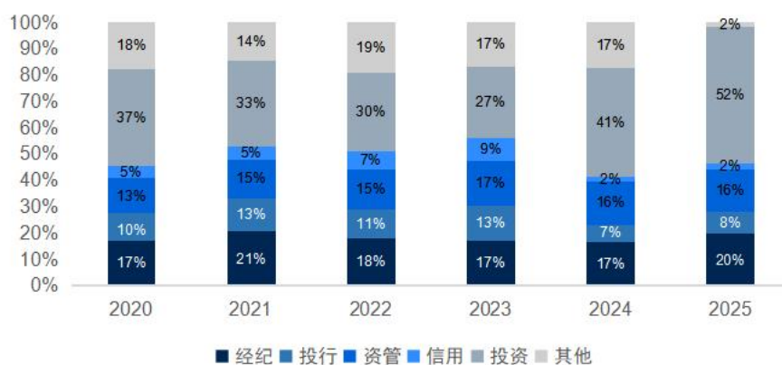
图 5: 中信证券主营业务结构