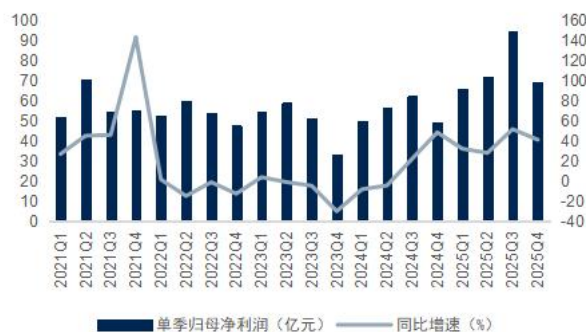
图4: 中信证券单季归母净利润及增速 (单位: 亿元)