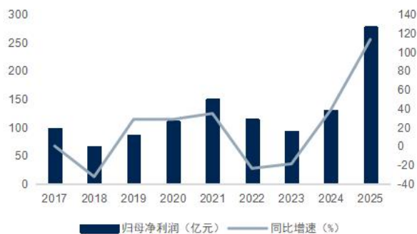
图3：公司归母净利润及增速（单位：亿元）