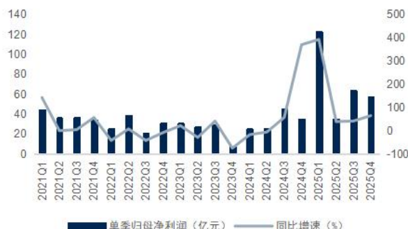
图4：公司单季归母净利润及增速（单位：亿元）