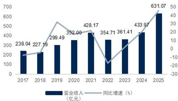
图1：公司营业收入及增速（单位：亿元）