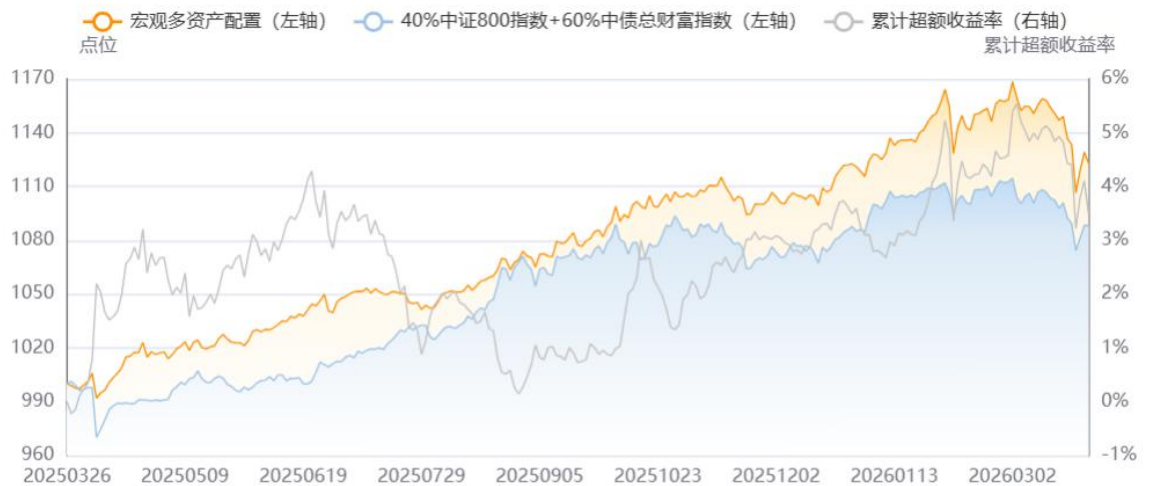
图4：国内宏观多资产配置组合表现

【国内宏观多资产模型】 截至3月27日，近一年的收益率为12.31%，超过基准（40%中证800指数+60%中债总财富指数）的超额收益率为3.49%。近一年的夏普比率为1.6151，超过基准的夏普比率1.1618。