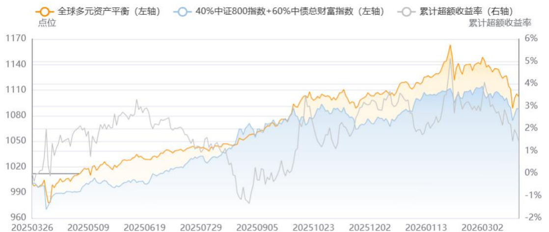
图5：全球宏观多资产配置组合表现

【全球宏观多资产模型】 截至3月27日，近一年的收益率为10.26%，超过基准（40%中证800指数+60%中债总财富指数）的超额收益率为1.44%。近一年以来的夏普比率为1.2879，超过基准的夏普比率1.1618。