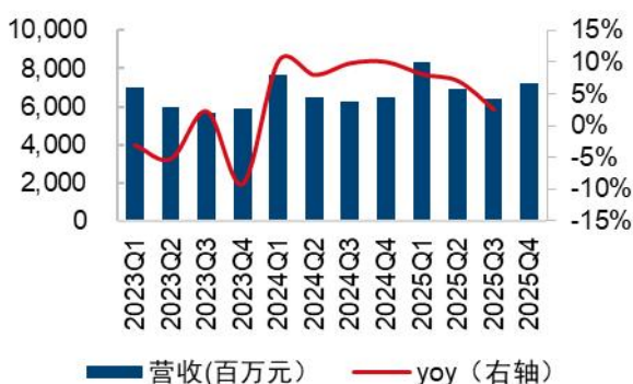
图1：公司营收（百万元）及 yoy