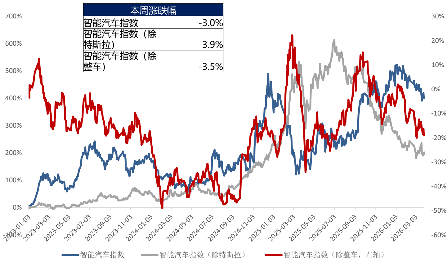
图：智能汽车指数跟踪

注：市值参考日期为2026年3月27日，单位均为亿元人民币，港股市值按2026年3月27日1HKD=0.88CNY计算，美股市值按2026年3月27日1USD=6.91CNY计算。