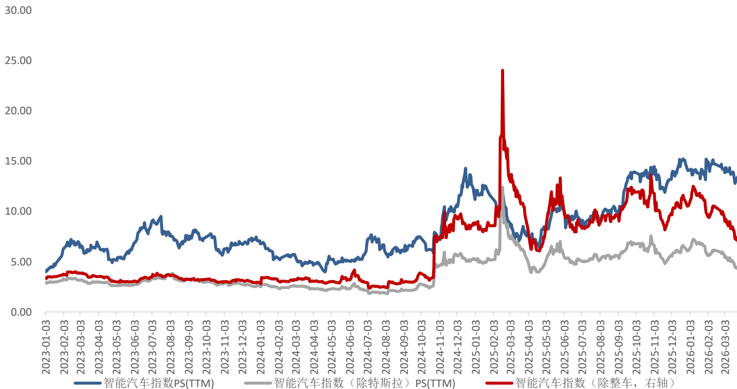
图：智能汽车指数估值跟踪

注：市值参考日期为2026年3月27日，单位均为亿元人民币，港股市值按2026年3月27日1HKD=0.88CNY计算，美股市值按2026年3月27日1USD=6.91CNY计算。