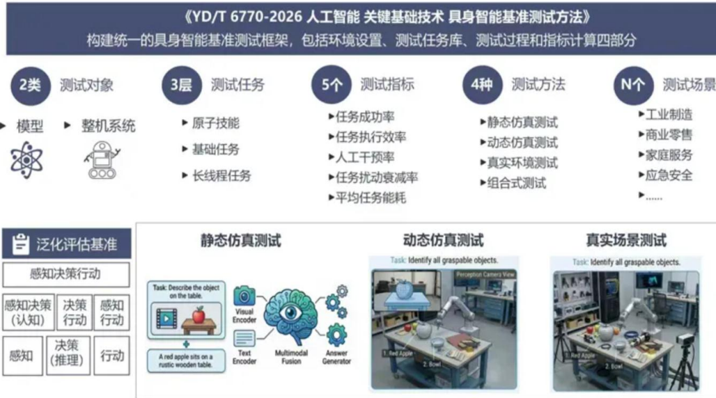
图 2: 《YD/T 6770-2026 人工智能关键基础技术具身智能基准测试方法》