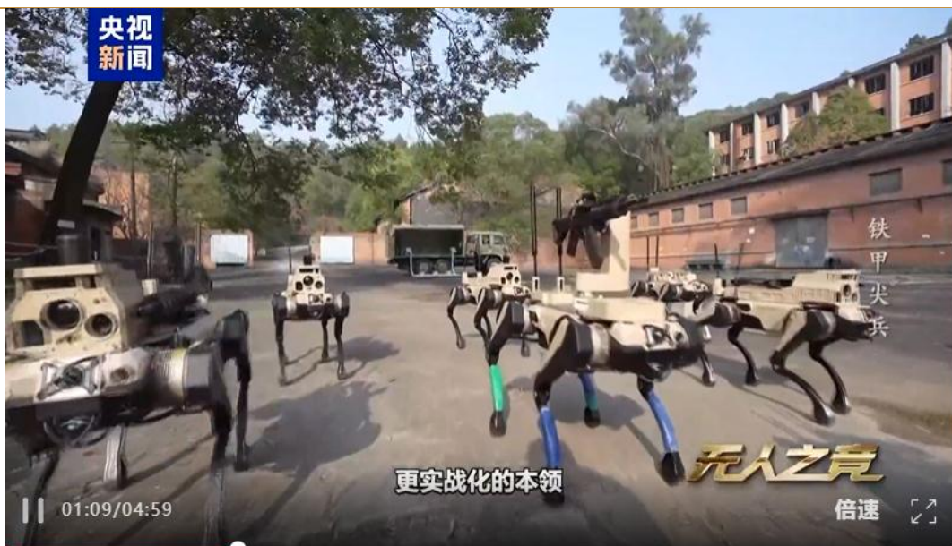
图4：央视新闻发布“机器狼群”城市巷战演练视频

此外机器狼与空中无人机能够实现有机连接，能做到空地一体化，协同出击。在演练画面中，三联屏指挥终端不仅控制着地面的“狼群”，还统一调配着空中的无人机。侦察无人机提供广域监视，机器狼群提供地面突防与精确清除，这种“陆空一体”的协同，构建了完整的“侦、打、评、保”闭环。