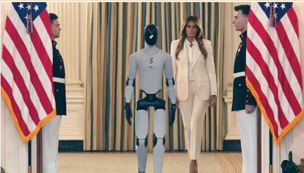
图 3: Figure 03 亮相白宫教育峰会

Figure 03 亮相白宫教育峰会。 3月25日, 美国第一夫人梅拉尼娅·特朗普在白宫举办的“携手共创未来”教育峰会上, 携人形机器人 Figure 03 亮相。Figure 03 由加州初创公司 Figure AI 研发, 身高 1.73 米, 重 61 公斤, 采用自主研发的 Helix AI 系统, 具备多语言交流、自主移动和家务处理能力。Figure 03 已经在厨房和客厅两大家庭场景中完成了多项复杂任务的验证测试, 全程自主且流畅。实现这一点的关键在于 Helix 系统的升级。Helix 02 系统采用单一通用神经架构, 在原有快慢双系统架构基础上引入全新的 System 0, 构建起一套“理解指令-拆解动作-控制执行”的紧密层级系统。该系统无需额外工程代码, 只需输入相关训练数据, 即可快速掌握新技能。