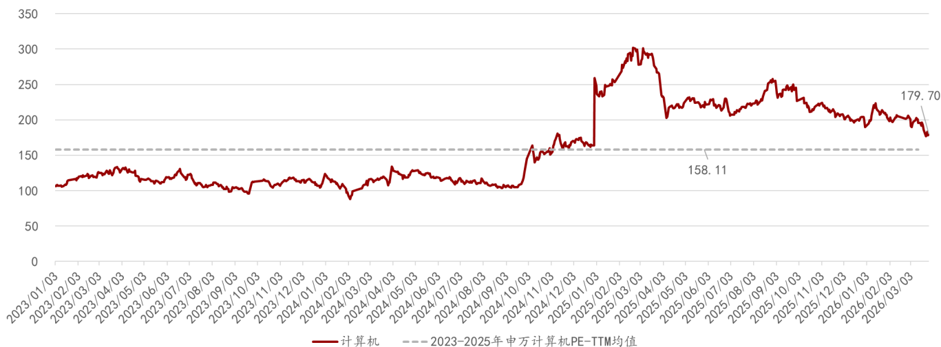
图表3: 申万计算机行业估值情况(PE-TTM, 单位: 倍)

行业估值水平较高且高于历史中枢水平。从估值情况来看,申万计算机行业2026年3月27日PE-TTM为179.70倍,处于较高水平,且高于2023-2025年历史PE-TTM的均值158.11倍。