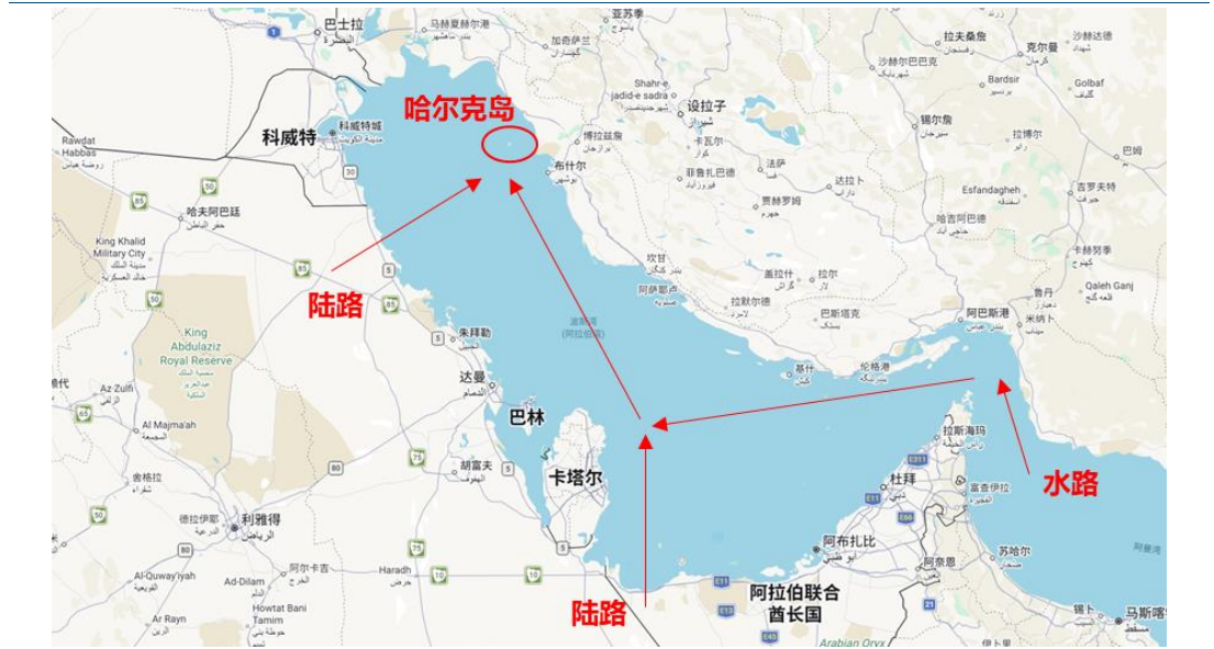
图表5: 进攻哈尔克岛的示意图

因此，如果要凭借哈尔克岛实现事态降级，既需要美军打一场“漂亮仗”，在不伤及岛上能源设施的情况下占据岛屿，还需要伊朗“解风情”，在丢失岛屿后愿意与美国停火谈判，而不是用导弹/无人机持续消耗，前景难料。实际上，卡特也曾在1980年考虑过占领哈尔克岛、迫使伊朗人接受谈判，由于担心人员伤亡和能源危机，最终作罢。