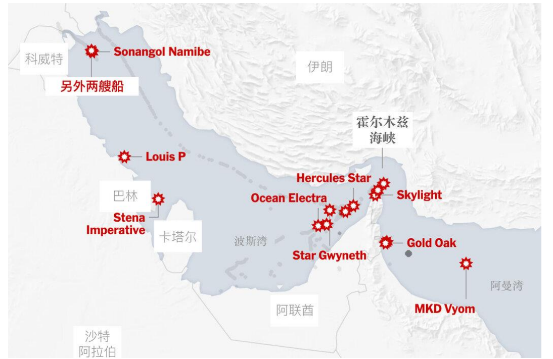
图表4: 伊朗可以在海岸线上袭击波斯湾内的油轮

更棘手的是, 即便控制了海峡, 也只是打开了一扇门, 油轮需要进入波斯湾内加油。伊朗在波斯湾的海岸线超过 1500 公里, 美军不太可能在如此漫长的海岸线上布防。而伊朗只需要在海岸线附近打击波斯湾内的油轮, 就可以继续从事事实上封闭航道。与此同时, 对于登岛的美军来说, 不仅需要面对导弹/无人机的消耗, 岛上的后勤补给也很麻烦, 如果选择撤退, 又会面临更大的伤亡风险, 届时整个过程很可能耗时一个月以上。这期间, 海峡航运将会彻底中断, 伊朗原先每天近 200 万桶的原油出口将成为新的供需缺口。