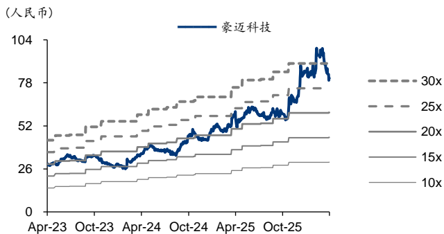
图表2: 豪迈科技 PE-Bands

注: 取自 ifind 及彭博一致预期, 数据截至 2026 年 4 月 2 日