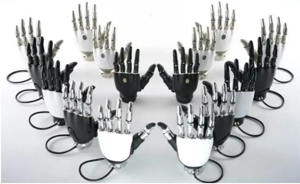
图表 7: 傲意科技 (OYMotion) ROHand 灵巧手家族