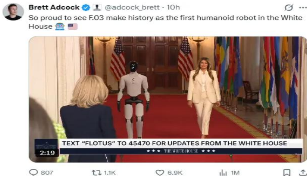
图表 5: Figure 3 在梅拉尼娅陪伴下出现在峰会举办的白宫东厅

个动作进行单独训练。不可否认的是，Figure 的发展路径得到了资本市场的高度认可。该公司成立于 2022 年，2023 年就完成了 7000 万美元的 A 轮融资，2024 年 2 月完成了 6.75 亿美元的 B 轮融资，并在去年 9 月筹集超过 10 亿美元，其投资者包括英伟达、微软、亚马逊创始人贝索斯等。Figure AI 在最新一轮融资中估值高达 390 亿美元，是全球估值最高的人形机器人公司。该公司在最新一轮融资中指出，该轮资金将主要用于规模化部署，计划未来四年交付 10 万台机器人。