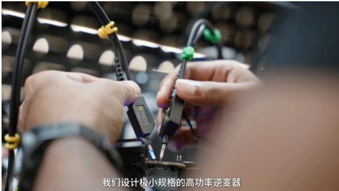
图表 3: 特斯拉视频展示机器人工厂内部技术细节