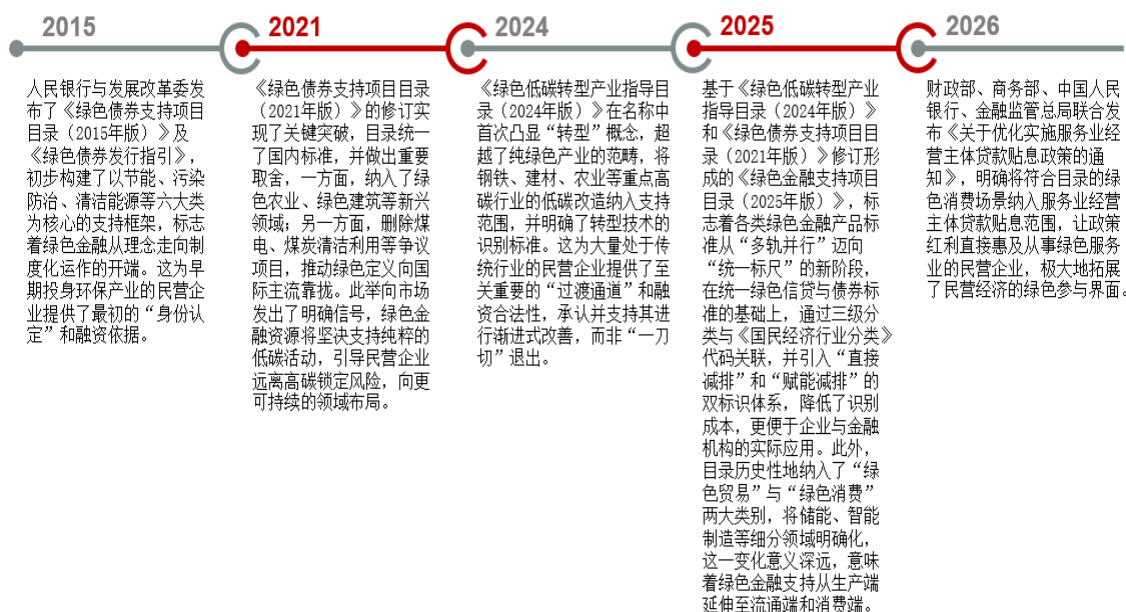
图1 2015年以来绿色金融支持政策情况

作为支撑这一转型的核心金融力量，中国的绿色金融在“十四五”时期实现了从框架建立到系统完善的跨越式发展。政策体系、市场规模、产品创新与国际合作的多维跃进，为我国经济社会的绿色变革注入了强劲动能，也为民营企业划定了清晰的转型赛道。