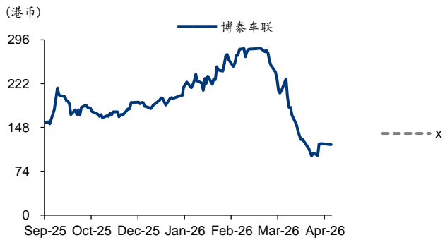
图表2: 博泰车联 PE-Bands

注: 收盘价为 2026 年 4 月 8 日数据, 可比公司预测源于 iFind 一致预期。