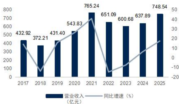
图1: 中信证券营业收入及增速 (单位: 亿元)