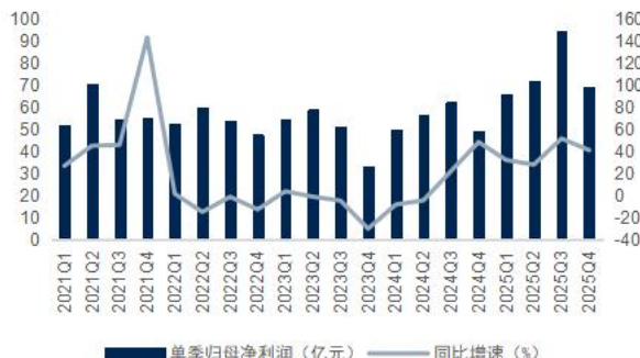
图4: 中信证券单季归母净利润及增速 (单位: 亿元)