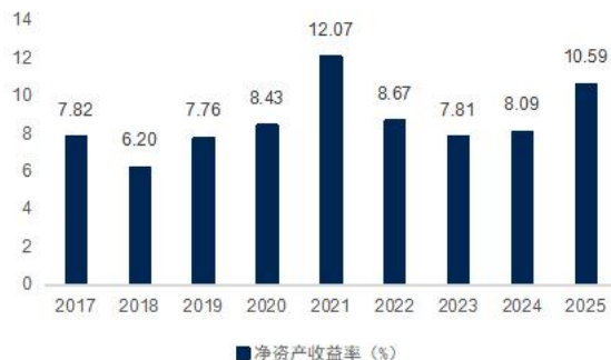
图2: 中信证券加权平均 ROE 变动趋势