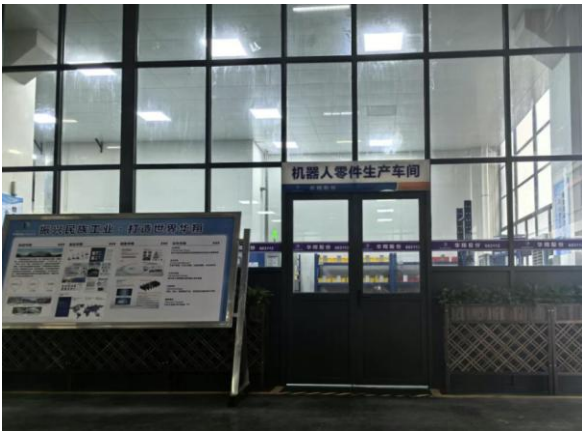
图1：华翔广东顺德工厂“人形机器人零部件”首条产线投产

广东顺德工厂“人形机器人零部件”首条产线投产，支撑“新兴赛道爆发增长”。2025年12月10日，华翔广东顺德工厂人形机器人精密零部件首条生产线已完成全部高精尖核心设备的安装调试，并实现稳定生产。标志着华翔在进军人形机器人核心零部件产业的战略路径上，迈出了坚实而关键的一步。