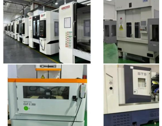
图2：引进并集成了多条由国际顶级加工设备组成的智能化产线