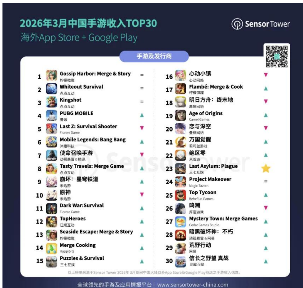
图3: 2026 年 3 月中国手游收入 TOP30|海外 AppStore+GooglePlay

根据 SensorTower 数据,2026 年 3 月中国手游收入前三名分别为柠檬微趣《Gossip Harbor: Merge&Story》、点点互动《Whiteout Survival》和点点互动《Kingshot》。