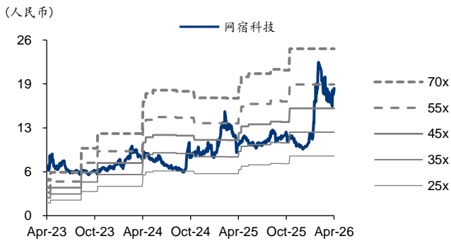
图2: 网宿科技 PE-Bands