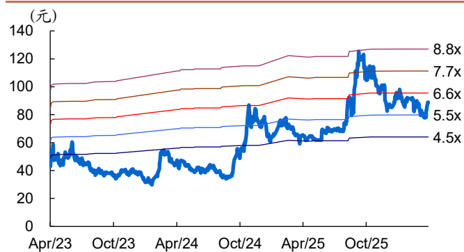
图 2: 中科曙光历史 PB Band