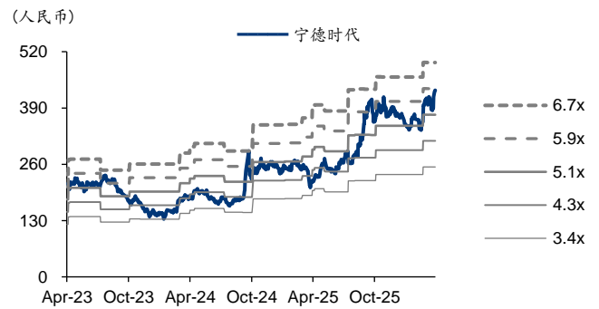
图表8: 宁德时代 PB-Bands