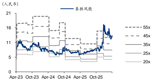
图表3: 泰胜风能 PE-Bands