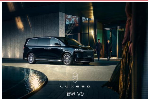
图表 4：智界 V9 定位中大型 MPV