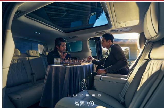
图表 5：智界 V9 二排旋转座椅具备超大对坐空间