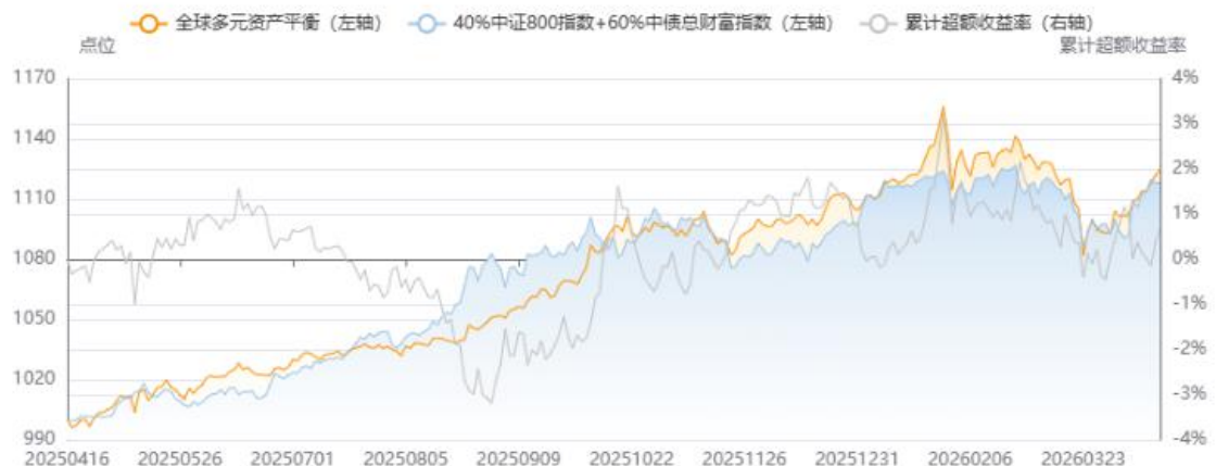
图5：全球宏观多资产配置组合表现

【全球宏观多资产模型】截至4月17日，近一年以来的收益率为12.47%，超过基准（40%中证800指数+60%中债总财富指数）的超额收益率为0.67%。近一年以来的夏普比率为1.76，基准的夏普比率1.73。