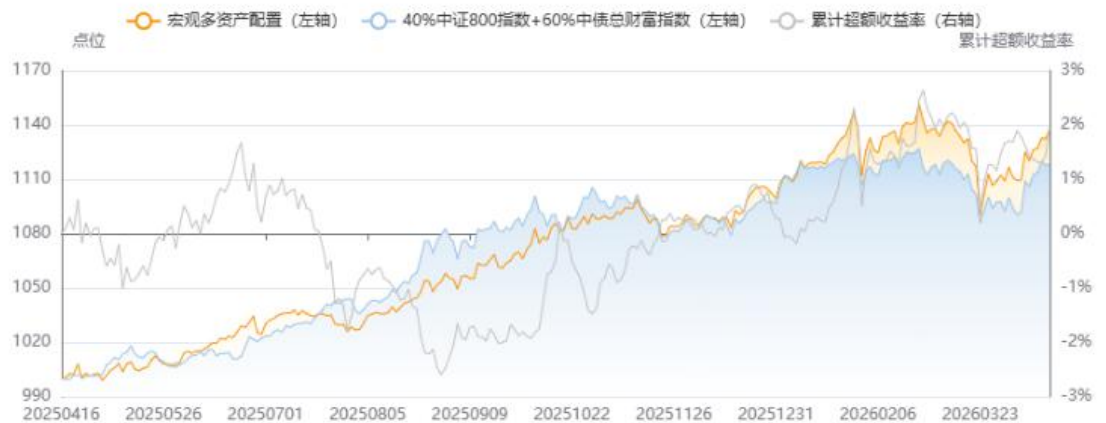
图4：国内宏观多资产配置组合表现

【国内宏观多资产模型】截至4月17日，近一年以来的收益率为13.75%，超过基准（40%中证800指数+60%中债总财富指数）的超额收益率为1.95%。近一年以来的夏普比率为1.82，基准的夏普比率1.73。