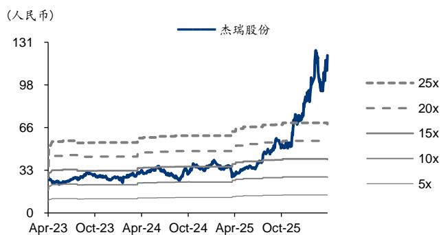
图表2: 杰瑞股份 PE-Bands