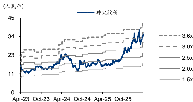
图表3: 神火股份 PB-Bands