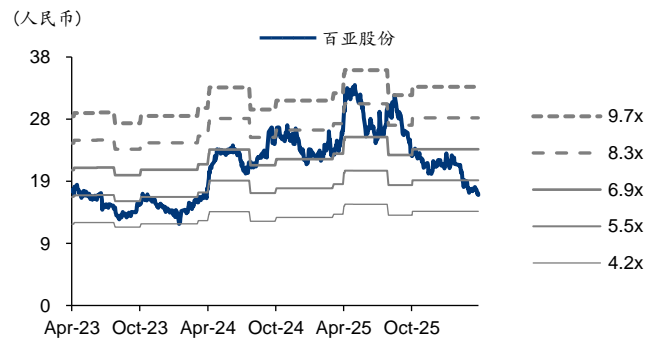
图表6: 百亚股份 PB-Bands