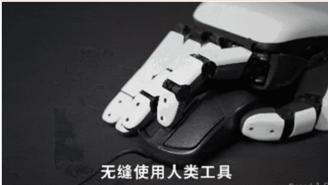
图表 6: Apex Hand 灵巧手具备 21 自由度