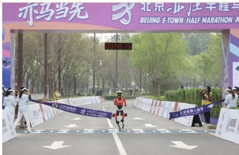
图表 2：人形机器人“闪电”获得冠军

本届赛事规模扩容近 5 倍，吸引全国 13 个省份超百支队伍参赛，覆盖北京人形机器人创新中心、荣耀、宇树、松延动力等头部企业，以及清华、北大、中科大等高校、科研院所等多元主体，并拓展 5 个海外队伍；技术类型涵盖自主导航与遥控两大类，其中自主导航 40% 左右，参赛数量、参与范围、技术类型均创历史新高。这不仅是一场技术竞技，打造全球顶尖技术验证场；更是推动产业升级的战略平台，“以赛促产”助推机器人技术从“功夫模式”向“打工模式”进化。