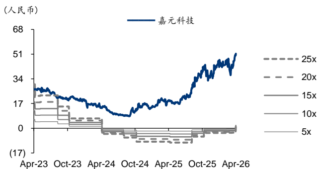
图表3: 嘉元科技 PE-Bands