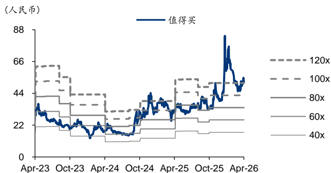
图2: 值得买 PE-Bands