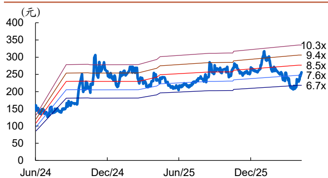
图 2: 达梦数据历史 PB Band