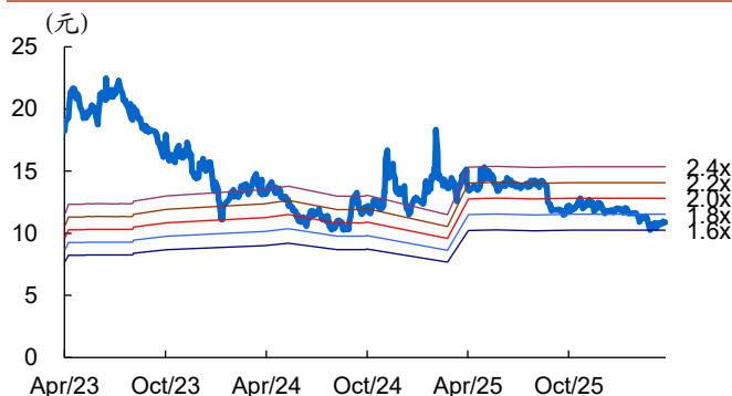
图 2: 佳禾食品历史 PB Band