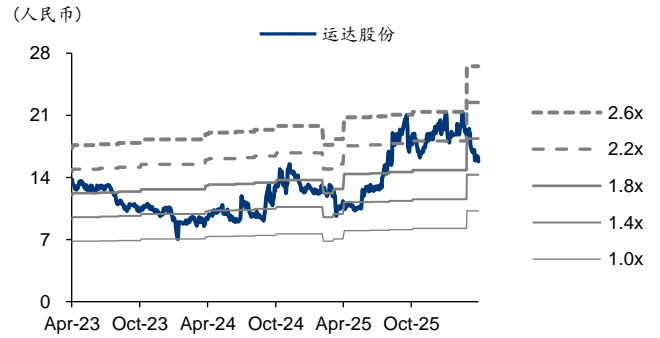
图表3: 运达股份 PB-Bands