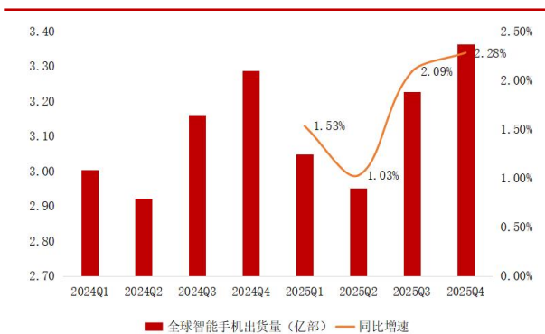
图 2：全球智能手机出货量

中国智能手机出货数据： 2026 年 2 月，中国智能手机出货量为 1,626 万台，同比下降 12.60%。